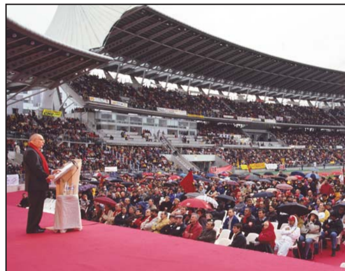
▲ Meeting au stade Charléty, le 7 octobre 2000.

le 16 juin 1982, lors de la 68 e session de la Conférence internationale du travail, de déposer formellement une plainte contre le gouvernement polonais de Jaruzelski pour violation des conventions 87 et 98 de l'OIT. Celui-ci avait décrété la loi martiale le 13 décembre 1981, suspendant les activités syndicales et le droit de grève, et emprisonnant les militants de Solidarnosc. Passion de la liberté qui l'amena, plus tard, à expliquer à Lech Walesa que bien que ne partageant pas sa conception du syndicalisme, il militait et militerait pour qu'il puisse l'exercer librement.