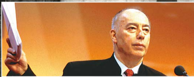
▲ XIX e congrès confédéral à Marseille, du 7 au 10 mars 2000.