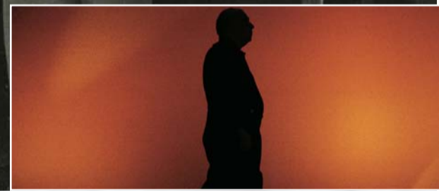
▲ XX e congrès confédéral à Villepinte, du 2 au 6 février 2004.