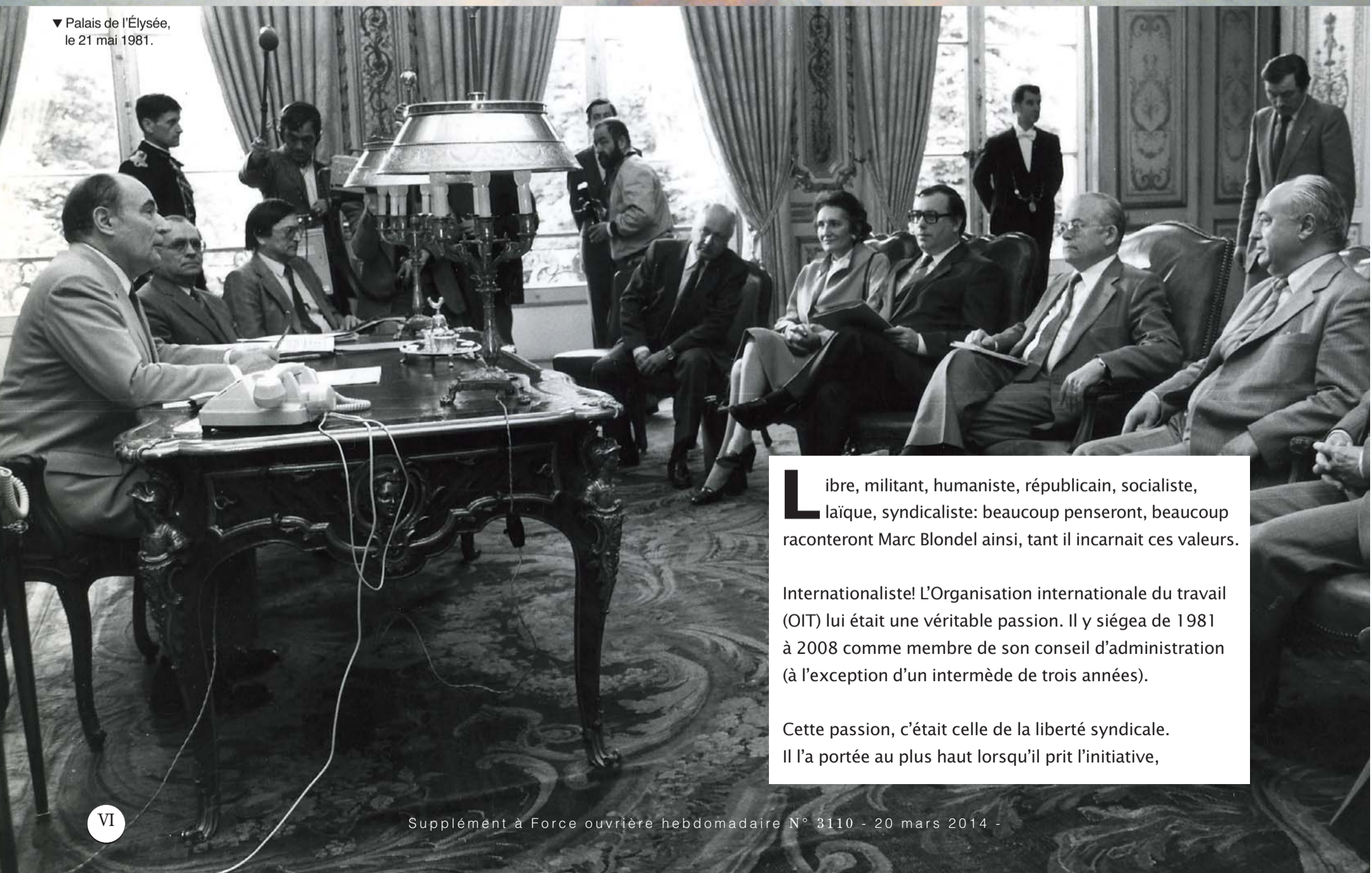
▼ Palais de l'Élysée, le 21 mai 1981.

L ibre, militant, humaniste, républicain, socialiste, laïque, syndicaliste: beaucoup penseront, beaucoup raconteront Marc Blondel ainsi, tant il incarnait ces valeurs.