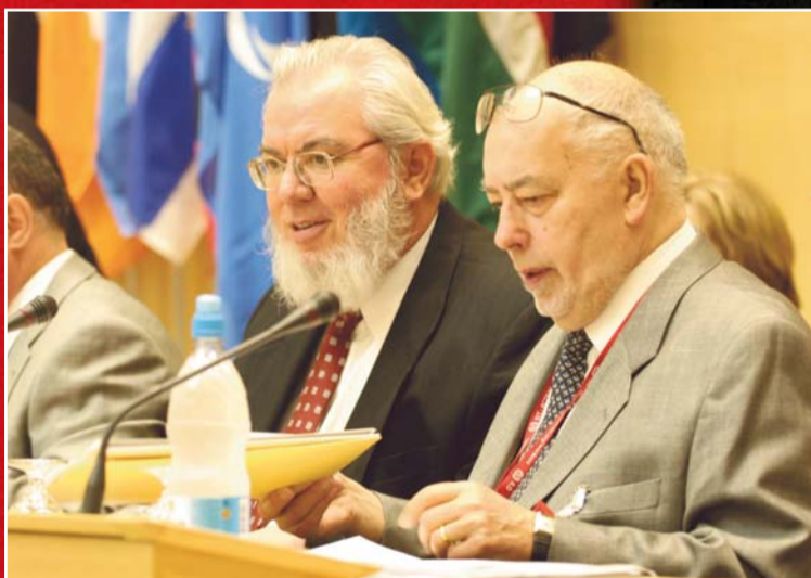
CIT 2007: il était alors vice-président de la Conférence, Juan Somavia était directeur général du BIT.

M arc Blondel était un syndicaliste. C'était un guerrier au service de la classe ouvrière internationale et un pilier central des développements de la CGT-FO.