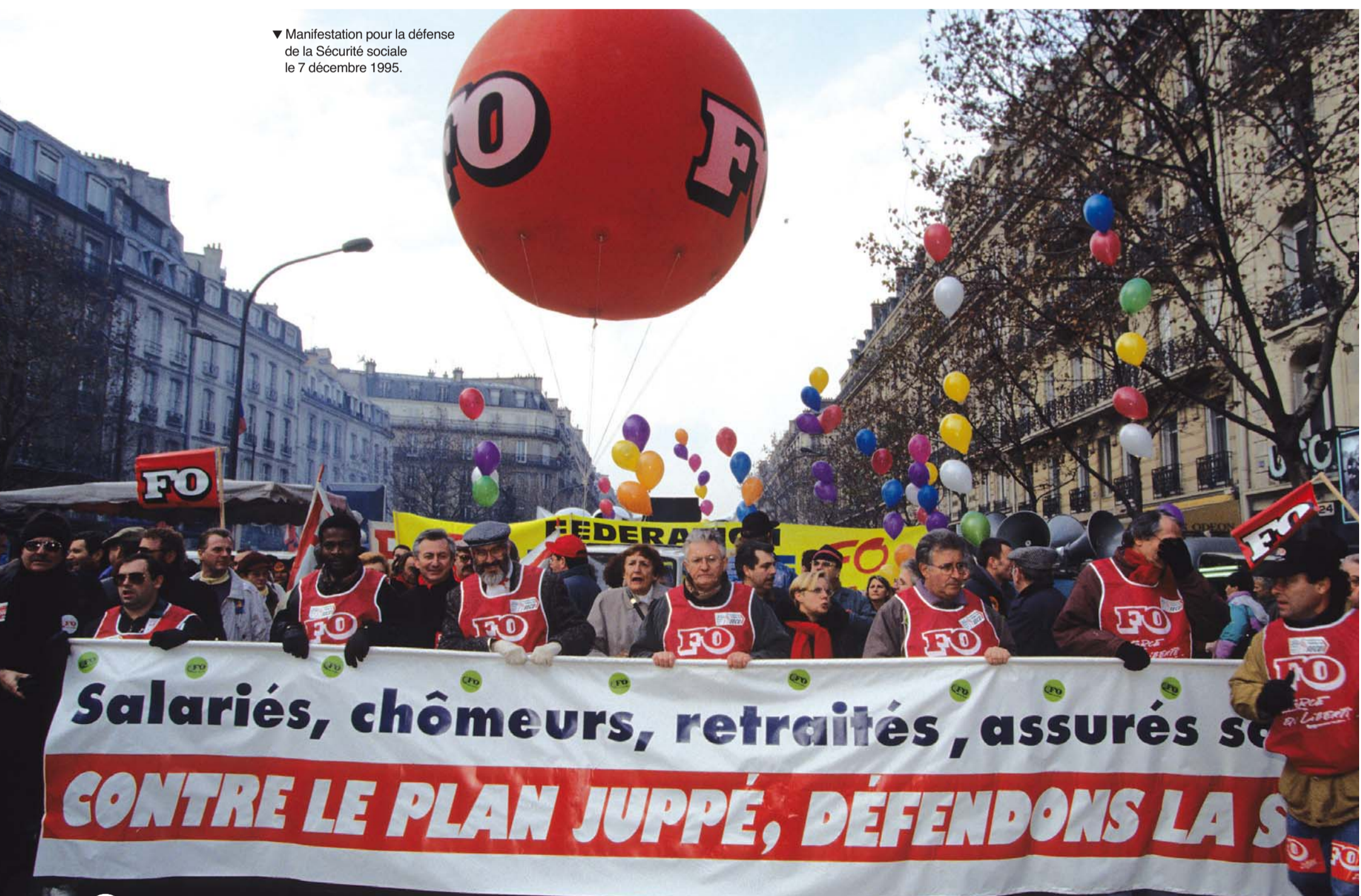
▼ Manifestation pour la défense de la Sécurité sociale le 7 décembre 1995.

Né le lendemain du 1 er Mai 1938 à Courbevoie (92), c'est à Hénin-Liétard, en plein pays minier du Pas-de-Calais, qu'il passe son enfance au sein d'une famille composée d'un père militaire qui rejoindra le réseau de résistance