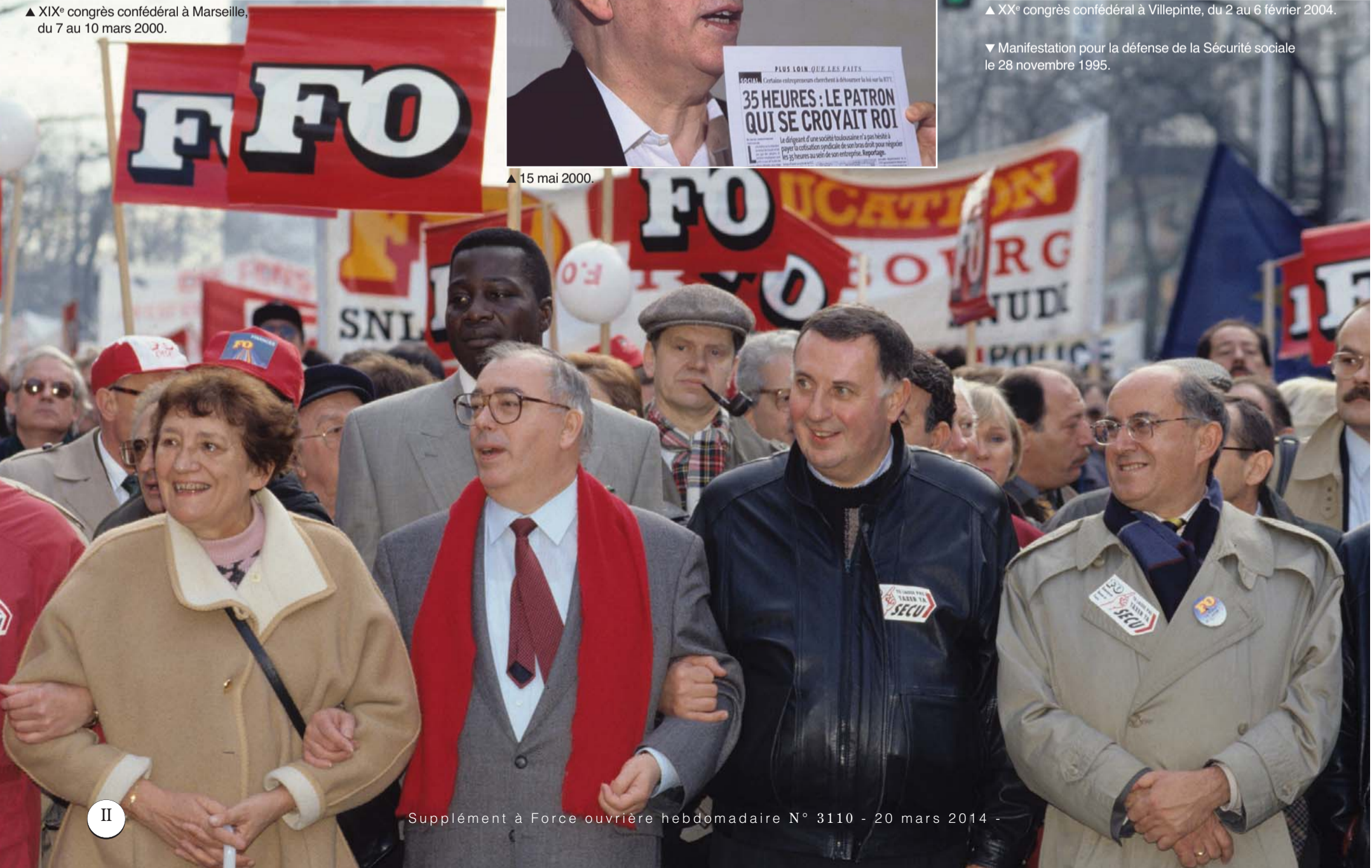
▼ Manifestation pour la défense de la Sécurité sociale le 28 novembre 1995.