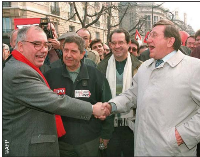
▲ Poignée de main entre M. Blondel et L. Viannet lors de la manifestation contre la réforme de la Sécurité sociale le 28 novembre 1995.

«Cela ne sert à rien de porter des jugements sur les hommes ; l'intéressant, c'est ce qu'ils représentent.»