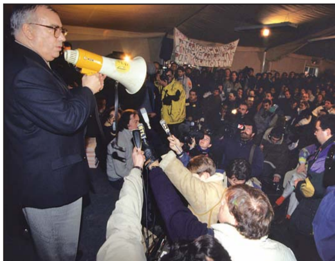
▲ Assemblée générale des cheminots à la gare du Nord en décembre 1995.