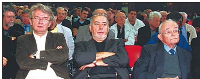
▲ Colloque pour les 100 ans de la Charte d'Amiens, le 4 octobre 2006.