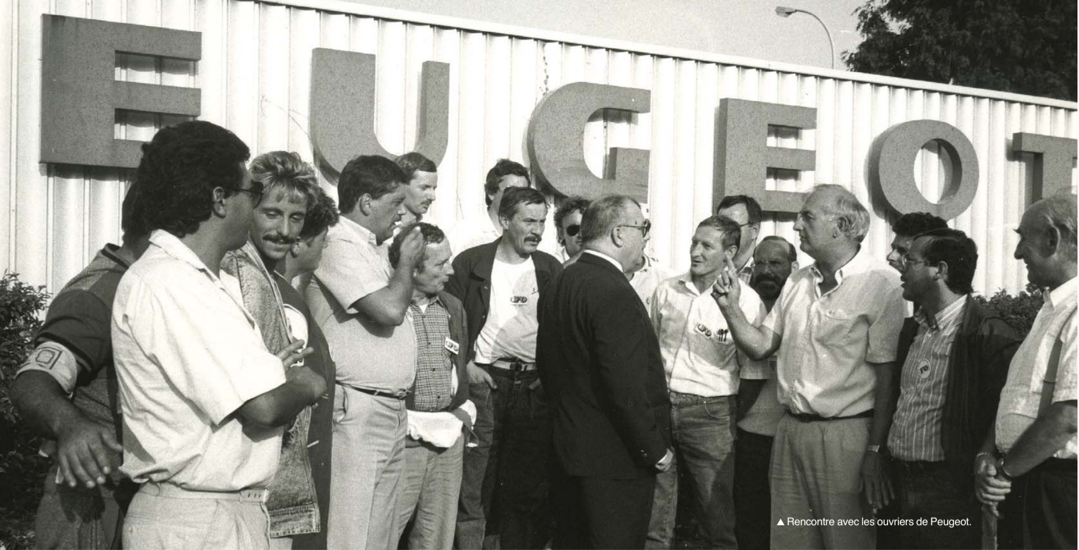
▲ Rencontre avec les ouvriers de Peugeot.